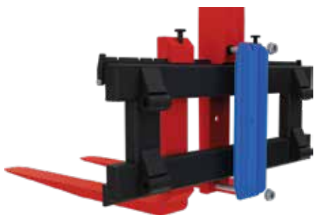
5.2.1 Montering av Multigrip

Kobles til lasteapparatets tredjefunksjon.