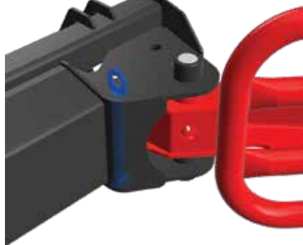
6.1 Låsning av gripearmer

Parkeres på trygg grunn, sikret mot å velte.