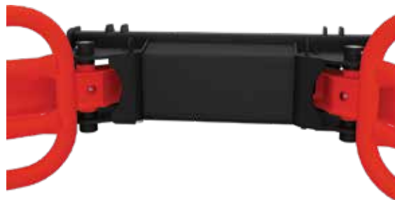
7.2 Smørepunkter fremside