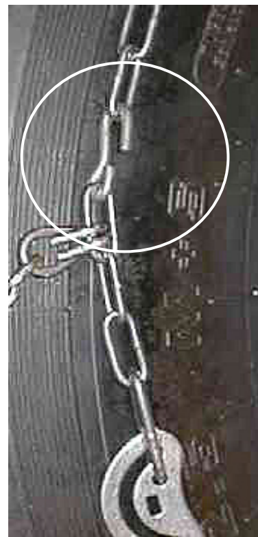
Feste låskrok i sidekjetting